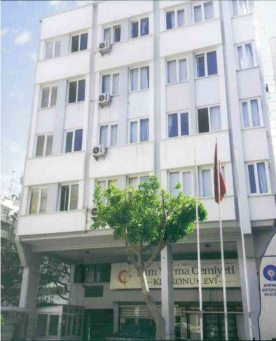
KIZ KONUK EVİMİZ

174 şube, 177 öğrenci yurdu ile 21.000 öğrenciye hizmet vermektedir. Cemiyetimiz 10/02/1953 tarih ve 4/169 sayılı kararı ile "Kamu Yararına Faaliyet Gösteren Derneklerden" sayılmıştır.