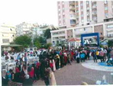
Oruç EtkinliĐi ve İftarlarımız