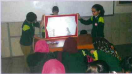
Kültürümüzü Tanıtıcı Etkinlikler