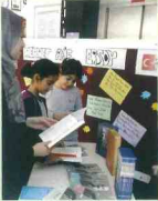
Kıtap Tanıtım Günleri