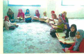
Kuran-ı Kerim Derslerimiz