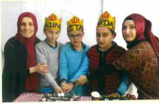
Kur'an'a Geçme Merasimi