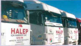
Halep'e Yardım Projesimiz