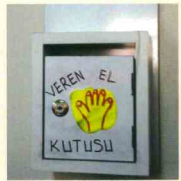
Sadaka Taşı Projesi