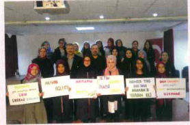
Bilinçli Nesiller Konferansı