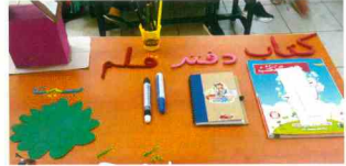
Arapça Ders Etkinlikleri