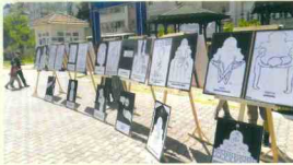
Kırk Hadis Sergisi