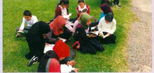
Doğa Yürüyüşü ve Kıtap Okuma Kampı