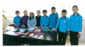
Kardeş Okula Kırtasiye Yardımı Kampanyamız