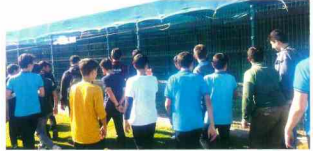
Hayvan Barınağı Ziyaretimiz