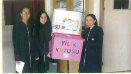
Oyuncak Toplama Kampanyamız