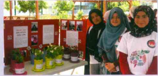
TUBİTAK Bilim Fuarı