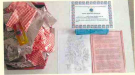
Önce Namaz EtkinliĐi