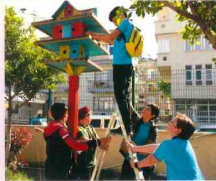
Kuş Evi Projesi