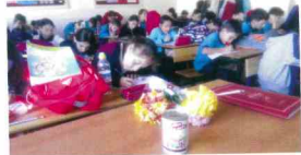
Her Sınıfın bir Yetim KardeŐi olsun